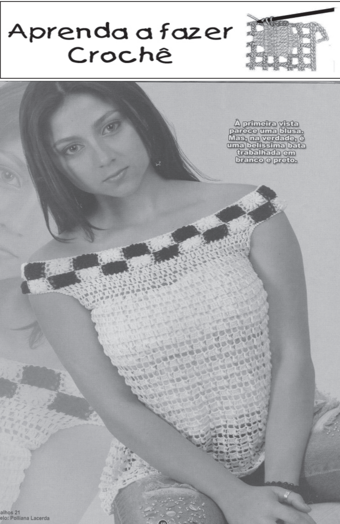
filhos 21

Também no afeto é preciso ser inteligente. A carne é fraca, porém podemos ser fortes. O mundo é redondo para que sofram os quadrados. Eduquem as crianças e não será necessário castigar os adultos. A civilização não suprime a barbárie, apenas a aperfeiçoa. Postergar é a mais mortal forma de negar.